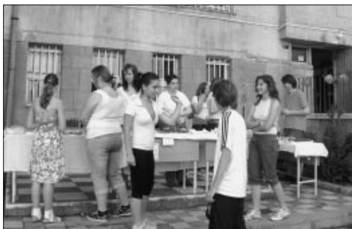
A büfében a diákok által készített sütitket és szendvicseket árulták