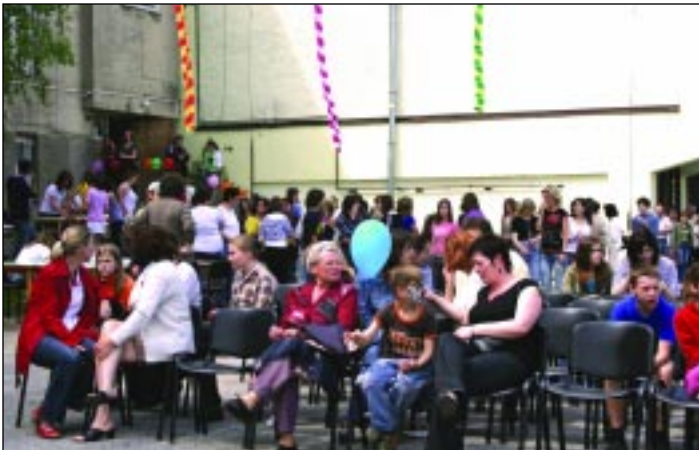
A nagyszámú nézőközönség még kint az udvaron várakozik