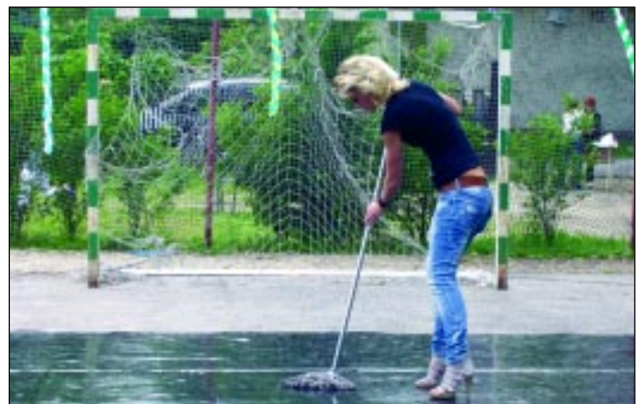
Az énekesnő, Sziszi aki éppen mikrofon helyett felmosófát ragadott