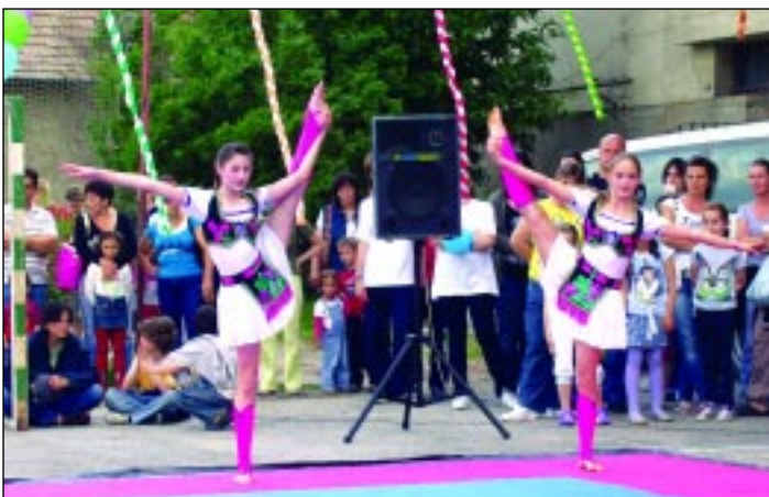
Artista bravúrokkal kápráztatott minket a fit-kid csapata