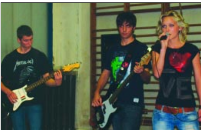
Itt már mikrofonnal a kezében a gimnázium együttesével a régi és az új felállásban zenélnek