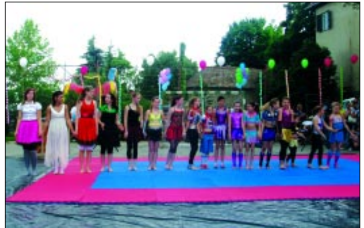
A fit-kides lányok apraja-nagyja