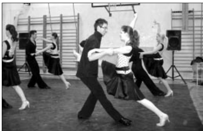
A néptánc és társastánc produkció eső miatt beszorult a tornaterembe