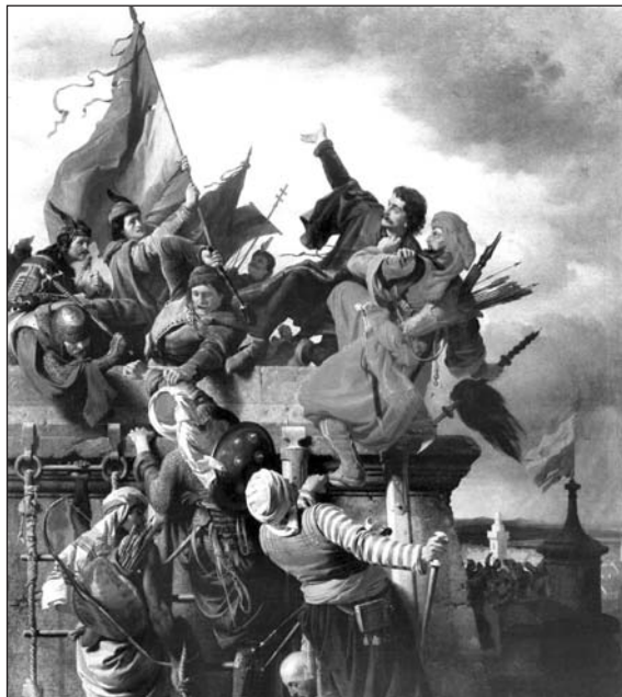
Dugovics Titusz önfeláldozása (Wagner Sándor festménye, 1859)

Önfeláldozó hősiességével az ismeretlen vitéz, akit a köztudat a horvát származású Dugovics Titusként ismer, lelket öntött az elcsüggedt védőkbe, s összezavarta az addig magabiztosan harcoló törököket. Az időközben Zimonyból áthajózott