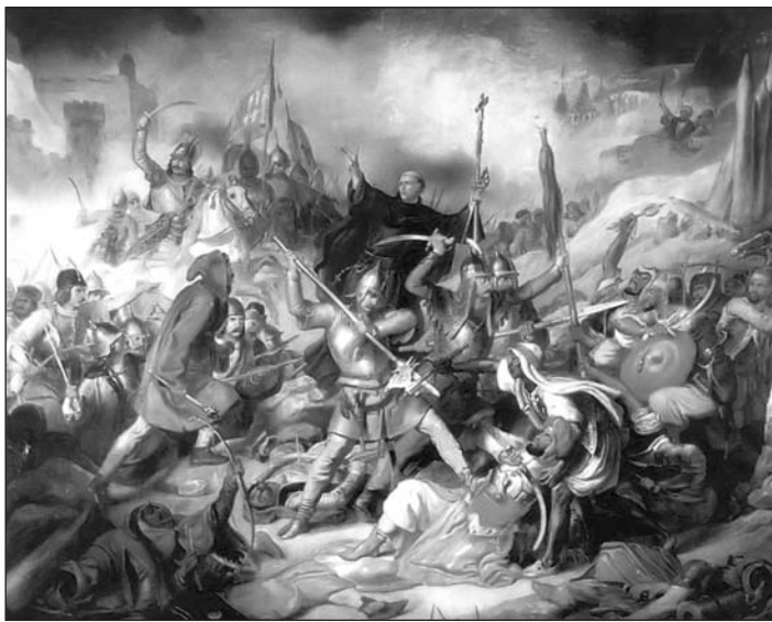
A nándorfehérvári csata (Ismeretlen festő, 19. század)

Ugyanakkor az oszmán hadvezetésnek igen komoly fejtörést okozott a váron kívül szétszórta állomásozó magyar csapatok mozgása. Nem véletlen, hogy a szultáni tanács ülésén nem alakult ki egységes álláspont a támadás stratégiájáról. A ruméliai főkormányzó, Dáji Karadzsa pasa magára vállalta, hogy hadtestével átkel a Dunán, és feltartóztatja Hunyadi bandériumát. A beglerbég elképzelésének gyakorlati megvalósulása az északon elhelyezett oszmán flotta szárazföldi megerősítését eredményezte volna. A javaslat el-