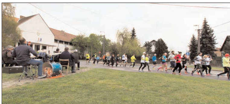
Fotó: Tóth József Figura